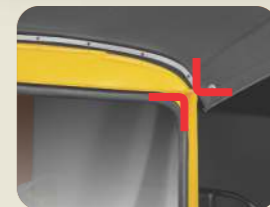
ലിക്വ് ബിൽഡ് ക്യാളിറ്റി