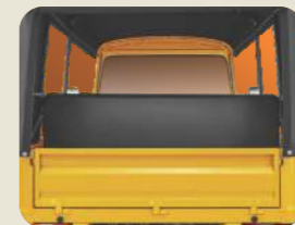
കൂടുതൽ ലഗേജ് സ്ഥലം