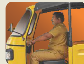
അതിവിശാലമായ ഡ്രൈവർ ക്യാബിൻ